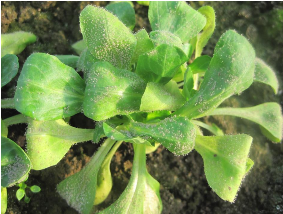
Abb.4: Sorte 'Pulsar' (RZ) mit starkem Falschem Mehltaubefall. Sporulation an Blattober- und Unterseite.