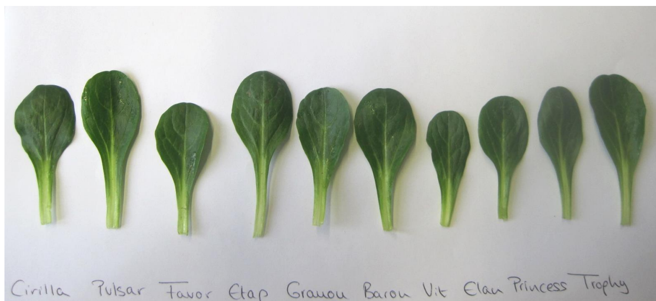
Abb.3: Einzelblätter der zehn verschiedenen Feldsalatsorten im Vergleich.